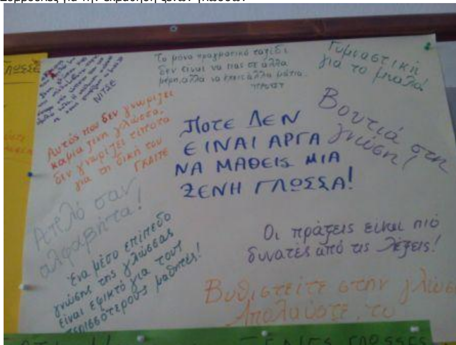
Γιατί μαθαίνω ξένες γλώσσες